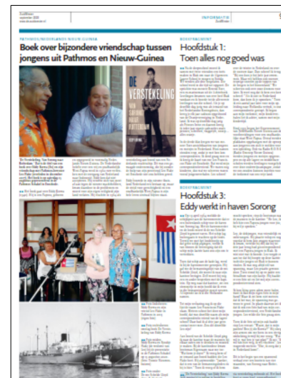
Berichtgeving in de 'Zuidwester'